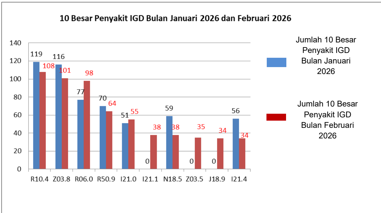
Grafik 1.2 10 Besar Penyakit Instalasi Gawat Darurat Periode Februari 2026